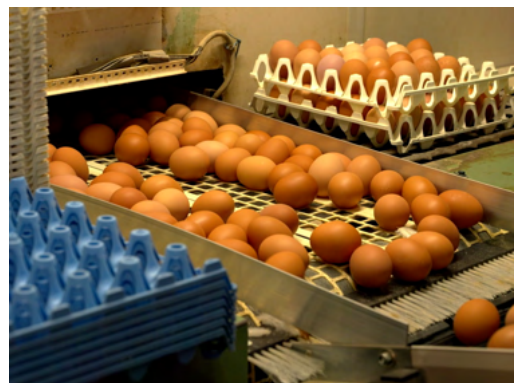
La ponte et le ramassage des œufs