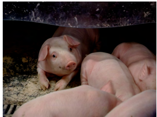
Cochons, chèvres et lapins