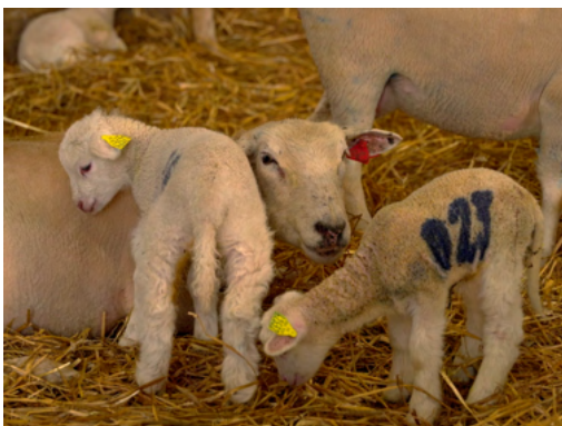
Brebis et agneaux