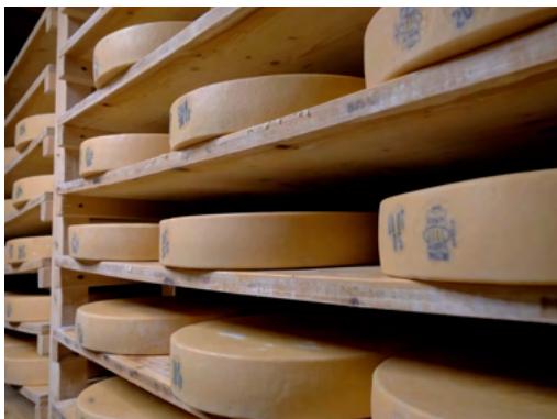
La fabrication du fromage