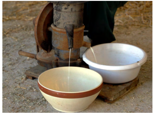
Du lait au beurre