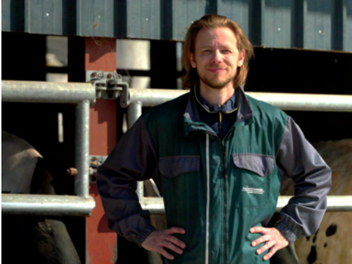
Le fermier de la laiterie