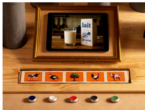
L'origine des aliments