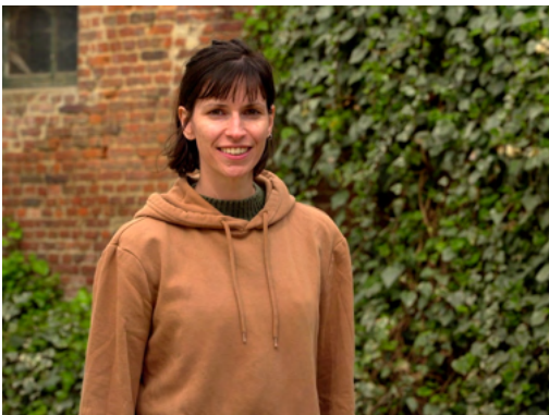
La fermière de la ferme des Quatre-Chemins