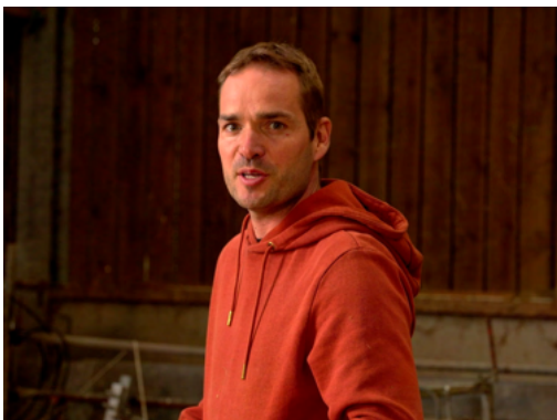
Le berger de la ferme des Grands-Vents