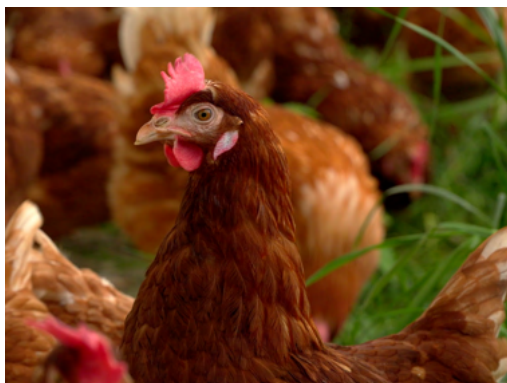
Poules et coq