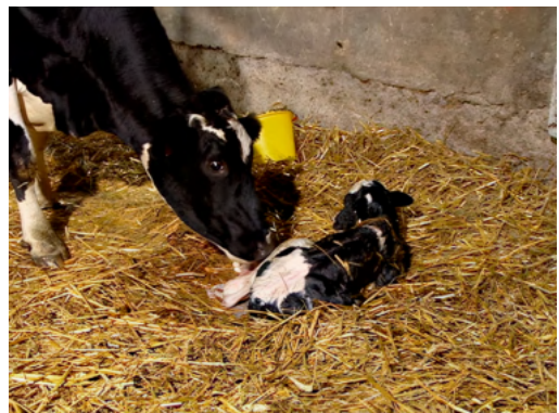
La naissance d'un veau