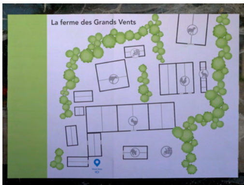
Se repérer sur un plan